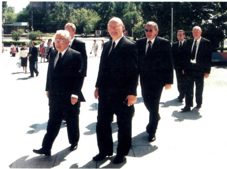
◁ Ankunft des Stammapostels und seiner Begleiter vor dem Kulturhaus

seligkeiten für den neuen Start eingepackt haben. Manches Mal verzögerte sich durch diese umfassenden Kontrollen der Abflug der Maschine um Stunden. Doch dieses Mal verläuft alles planmäßig. „Eine Traumreise“, bemerken manche der Brüder, die andere Reiseverhältnisse gewohnt sind. „Ich werde ab sofort mehr für unsere Missionsreisenden beten. Daß sie solche Strapazen auf sich nehmen, hätte ich mir nicht vorgestellt“, ziehen andere ihr persönliches Resümee dieser Reise. „Und daß der Stammapostel so ungewungen und locker ist, hätte ich auch nie gedacht.“ Gedanken, denen die Geschwister während des mehr als 5000 Kilometer langen Rückfluges nachhängen. pit