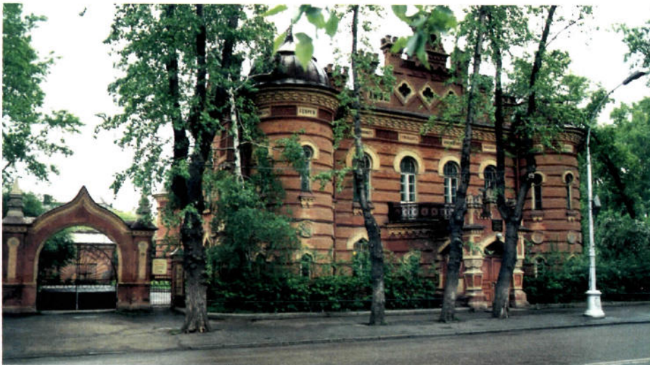
△ Eine Sehenswürdigkeit in Irkutsk: das historische Museum