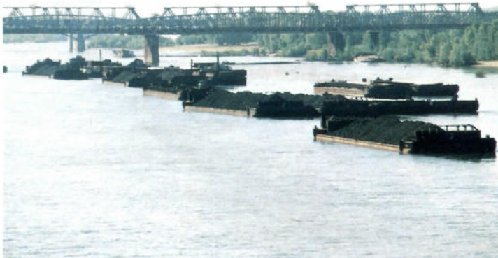
Lastschiffe und Lastkräne am Ufer des Ob \nabla \triangleright

Ende der 80er und Anfang der 90er Jahre begann in diesem Gebiet die Missionsarbeit für das Werk Gottes. Als ein Vorteil erwies sich zunächst, daß im Irkutsker Gebiet viele Rußlanddeutsche lebten. Dadurch bildeten sich rasch Gemeinden. Inzwischen stagniert jedoch die Entwicklung ein wenig. Denn viele Rußlanddeutsche reisen aus, und oft erhält der Apostelbezirk Sachsen-Anhalt Anfragen aus anderen Apostelbezirken, in denen sich Geschwister melden, die aus Sibi-