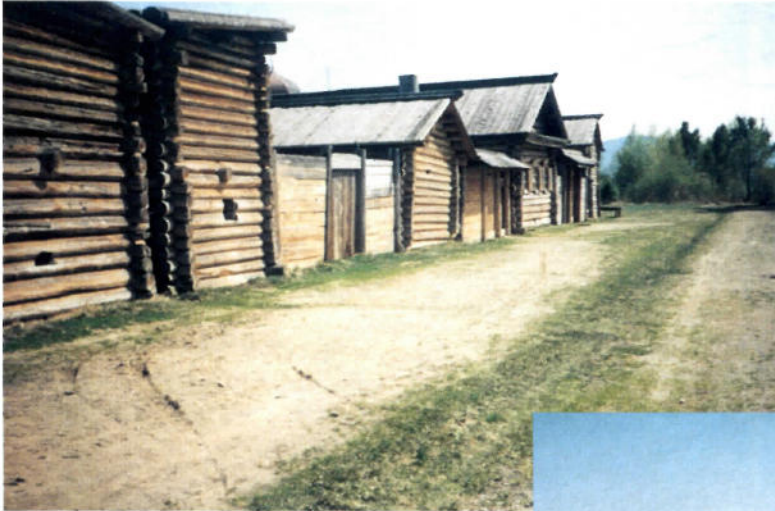
Holzhäuser in einem Museumsdorf nahe \Delta \triangleright des Baikalsees

Pünktlich hebt die Tupolev 154 der „Sibir-Air“ am Abend in Hannover ab. Nach rund sechs Stunden gibt es eine Zwischenlandung in Nowosibirsk. Es ist 7.10 Uhr Ortszeit, zu Hause ist es gerade mal 2.10 Uhr am Morgen. Aus dem hinteren Teil der Maschine erklingen Lieder; einige Sänger und Amtsträger haben Geburtstag. Der Aufenthalt in Nowosibirsk dauert etwas länger als vorgesehen, doch dank des Piloten wird die Verspätung auf dem Weiterflug nach Irkutsk fast aufgeholt.