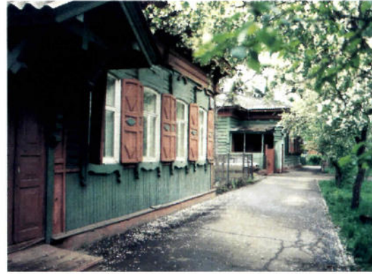
\triangleleft Straßenzug in Irkutsk

Einblicke in das Stadtbild von Irkutsk und die ostsibirische Landschaft erhält die Reisegruppe am nächsten Tag. Vor mehr als 300