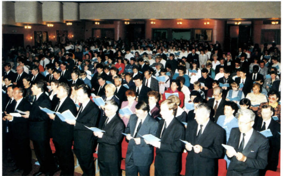
Die Fotos auf den Seiten 11–15 zeigen Szenen aus den Gottesdiensten in Nowosibirsk und Irkutsk

anders! Das ist uns von Gott gegeben. Und wir müssen nicht einfach glauben, daß das so ist bei uns, sondern wir erleben es.