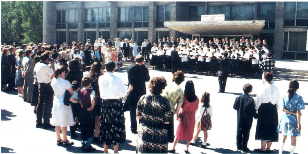
△ Nach dem Gottesdienst in Nowosibirsk singt der Zentralchor des Apostelbezirkes Sachsen-Anhalt vor dem Kulturhaus der Eisenbahner einige Lieder

rien ausgewandert sind. Trotz dieses Umstandes gab es im vergangenen Jahr keine Gemeinde in Sibirien, in der nicht Seelen versiegelt wurden. Jedoch, so räumen die Missionsarbeiter aus Sachsen-Anhalt ein, ist der Zuspruch nicht mehr so hoch wie in den Anfangsjahren.