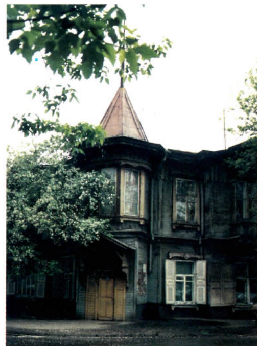
▷ Besondere Attraktionen im Stadtbild von Irkutsk sind Holzhäuser