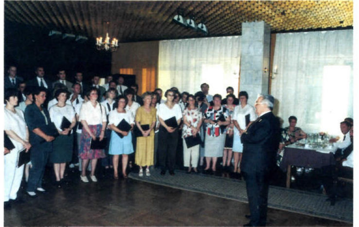
Der Stammapostel dankt dem Zentralchor des Apostelbezirkes Sachsen-Anhalt für sein gesegnetes Wirken während der gesamten Reise nach Sibirien ▽

seligkeiten für den neuen Start eingepackt haben. Manches Mal verzögerte sich durch diese umfassenden Kontrollen der Abflug der Maschine um Stunden. Doch dieses Mal verläuft alles planmäßig. „Eine Traumreise“, bemerken manche der Brüder, die andere Reiseverhältnisse gewohnt sind. „Ich werde ab sofort mehr für unsere Missionsreisenden beten. Daß sie solche Strapazen auf sich nehmen, hätte ich mir nicht vorgestellt“, ziehen andere ihr persönliches Resümee dieser Reise. „Und daß der Stammapostel so ungewungen und locker ist, hätte ich auch nie gedacht.“ Gedanken, denen die Geschwister während des mehr als 5000 Kilometer langen Rückfluges nachhängen. pit