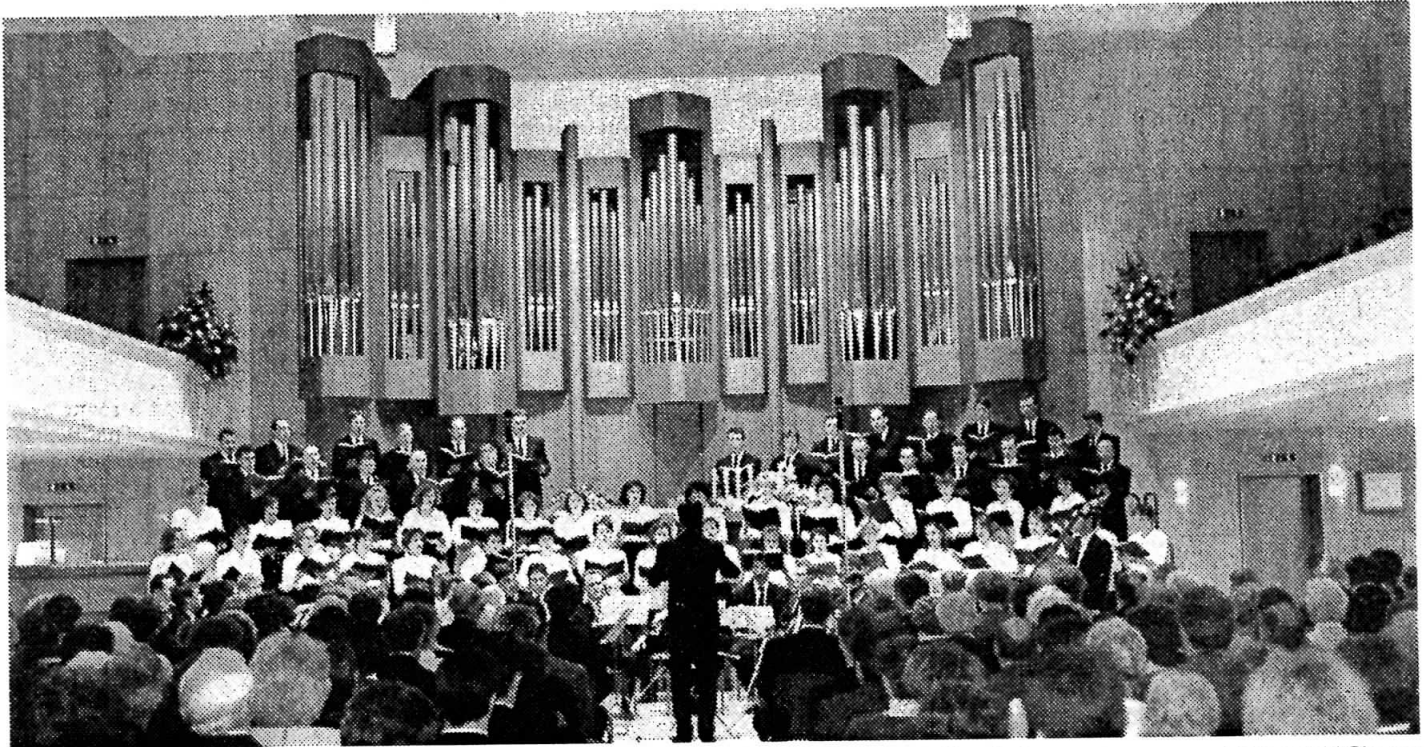
Die Neuapostolische Kirche in der Leipziger Straße weihte gestern feierlich ihre neue Orgel ein.