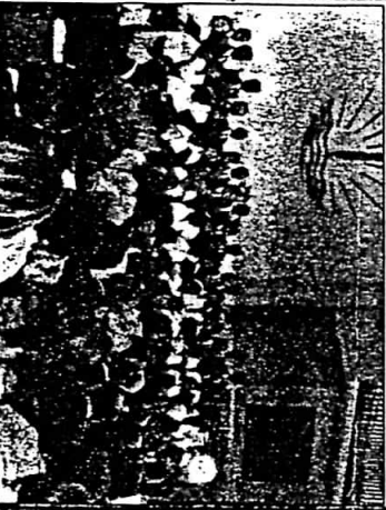
Vor allem der Chor und das Kammerorchester überzeu- gen bei dem Konzert in der Stendaler Kirche. Folgt...