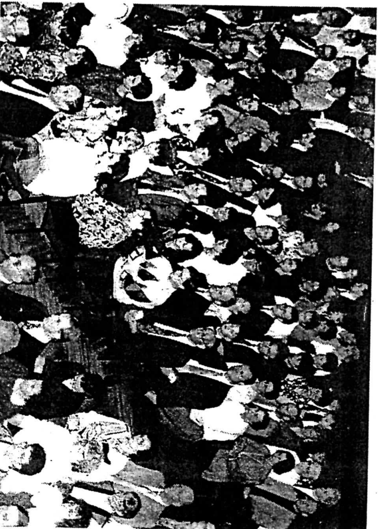
Andächtig lauschten die Anwesenden den musikalischen Darbietungen. Am Ende der Veranstaltung gab es nach anhaltendem Beifall Zugaben.